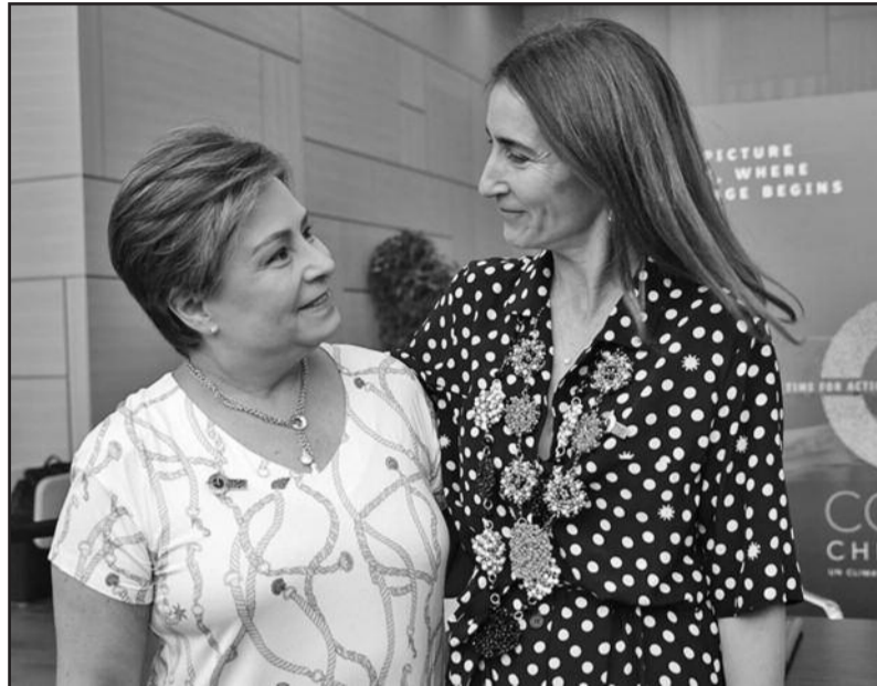
La secrétaire exécutive de la CCNUCC, Patricia Espinosa à gauche avec Carolina Schmidt, ministre de l'Environnement du Chili, présidente désignée de la COP 25.jpg

Également en chiffres, la secrétaire exécutive de la CCNUCC a rappelé que «dans le monde actuel, les faits comptent». Pour elle, quatre chiffres importaient: 1,5° C: l'un des objectifs clés de l'accord de Paris est de limiter la hausse de la température mondiale, 2050: quand les pays doivent atteindre la neutralité carbone, 2030: Quand les pays doivent limiter leurs émissions