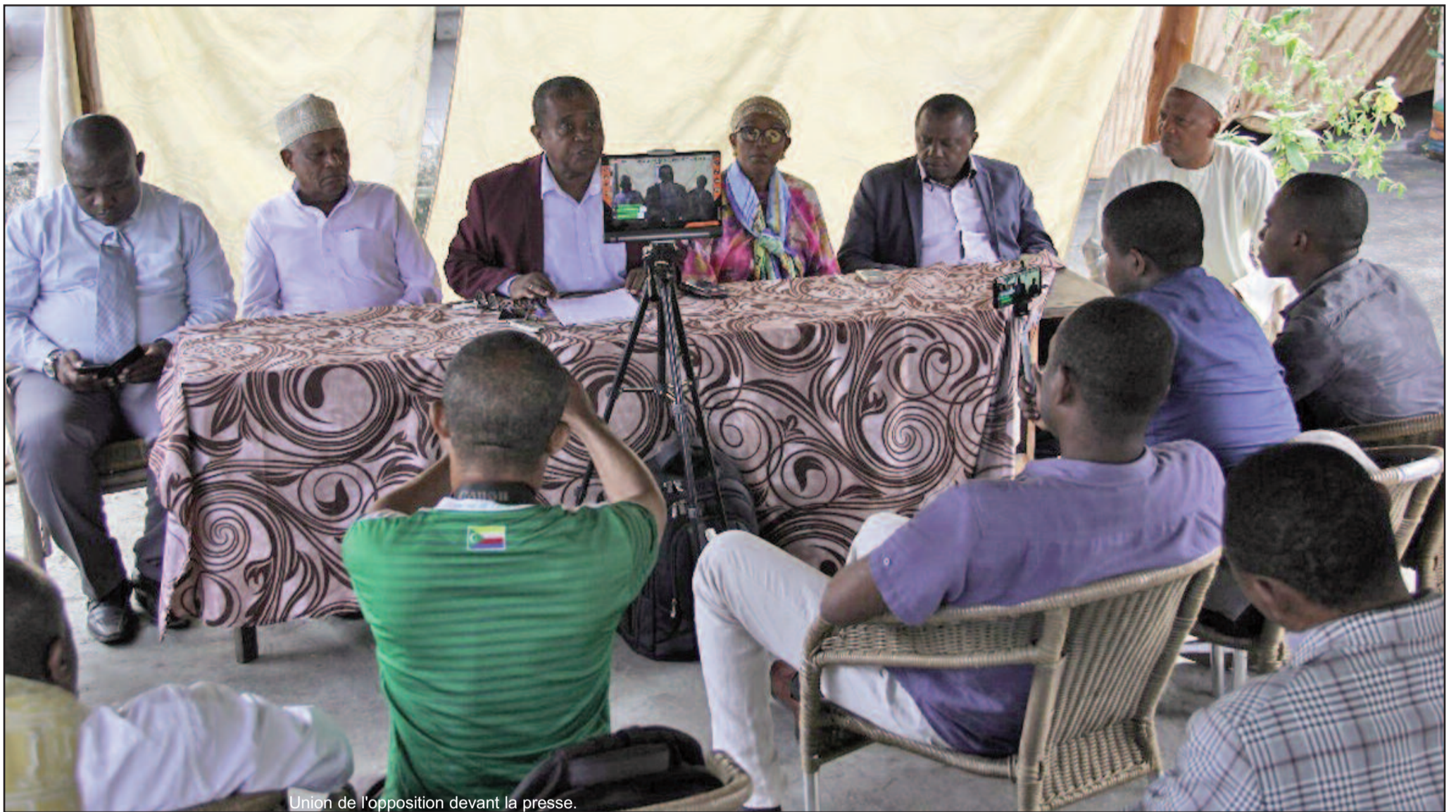
Union de l'opposition devant la presse.